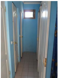
Санузел для номеров «Эконом»