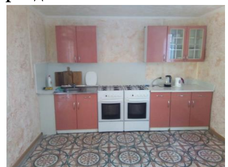
Кухня с верандой