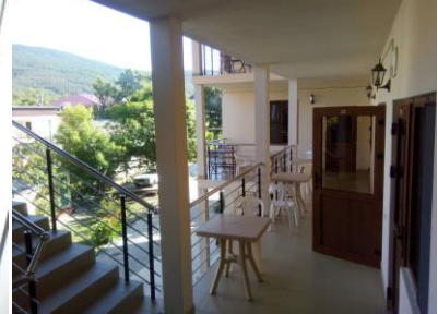
Веранда 2 этаж