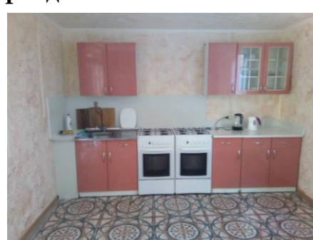
Кухня с верандой